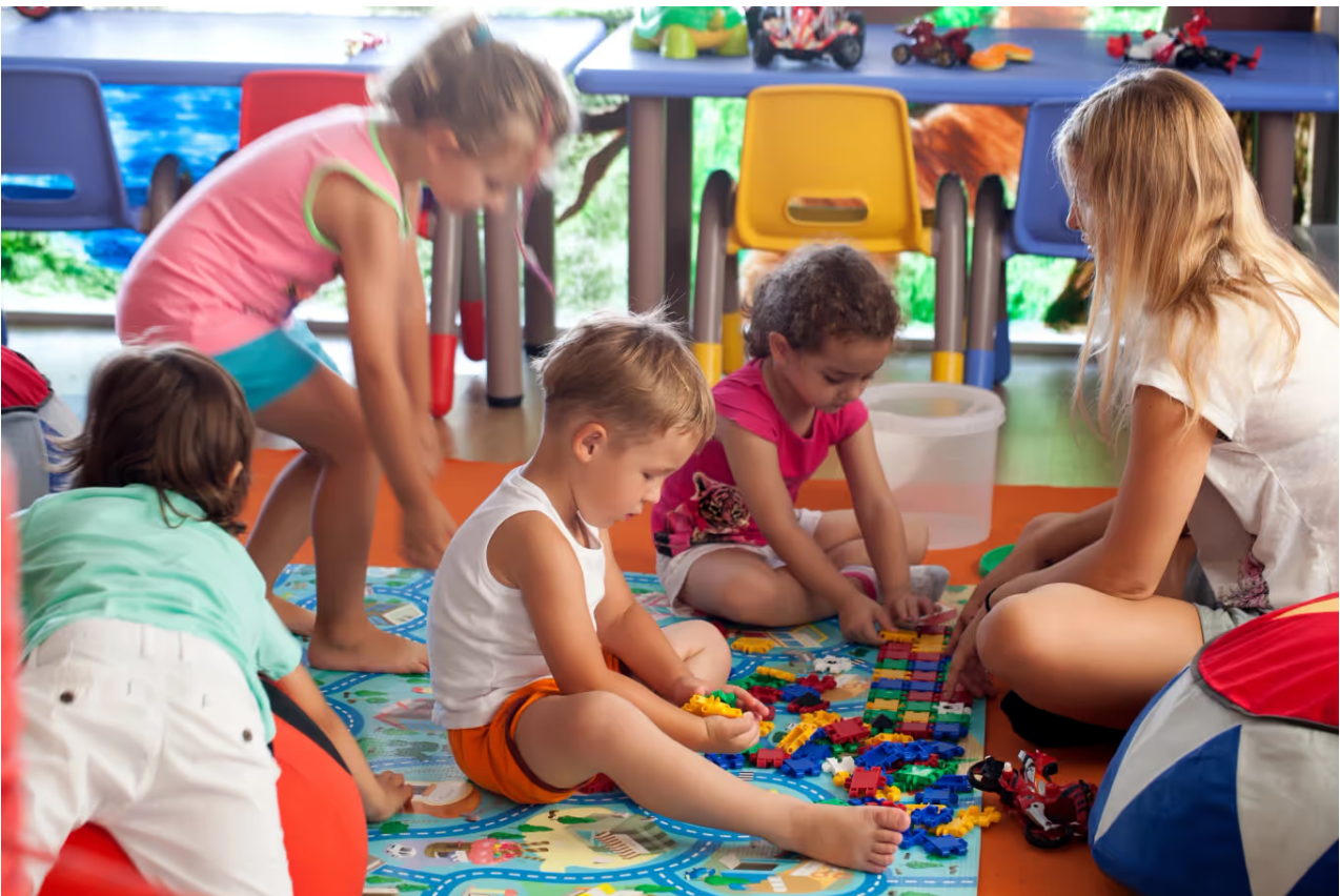
Kinder im Kindergarten-Alter haben viele Bedürfnisse. (Symbolbild)

Mit der obligatorischen Einschulung von Vierjährigen wurde die in diesem Alter eminent wichtige Aufgabe einer individuellen motorischen und sprachlichen Förderung den Familien weggenommen. Auch die beste Kindergärtnerin kann nicht auf die vielen Fragen, die jedes Kind in diesem Alter stellen möchte, eingehen. Sie wird zudem kaum den Bewegungsdrang dieser Kinder stillen können, sie auf Mäuerchen klettern und in ihre Arme springen lassen.